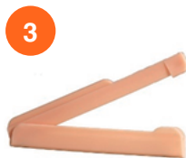
Pinza de cierre